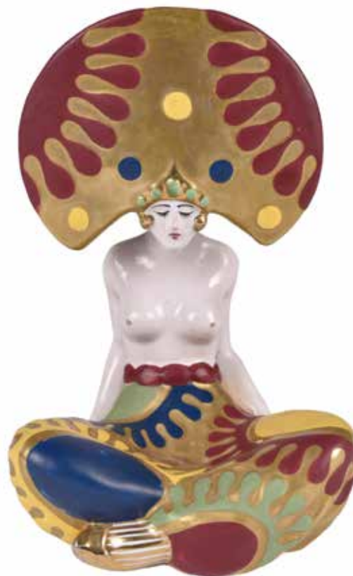
In copertina: Francesco Nonni, Bajadera, 1933. Collezione privata.